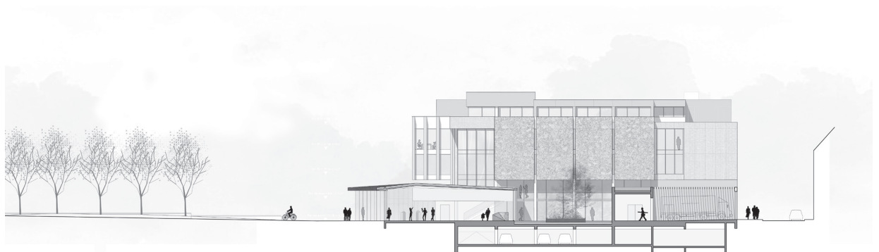
ÉLÉVATION NORD - LE BÂTIMENT VOLTAIRE