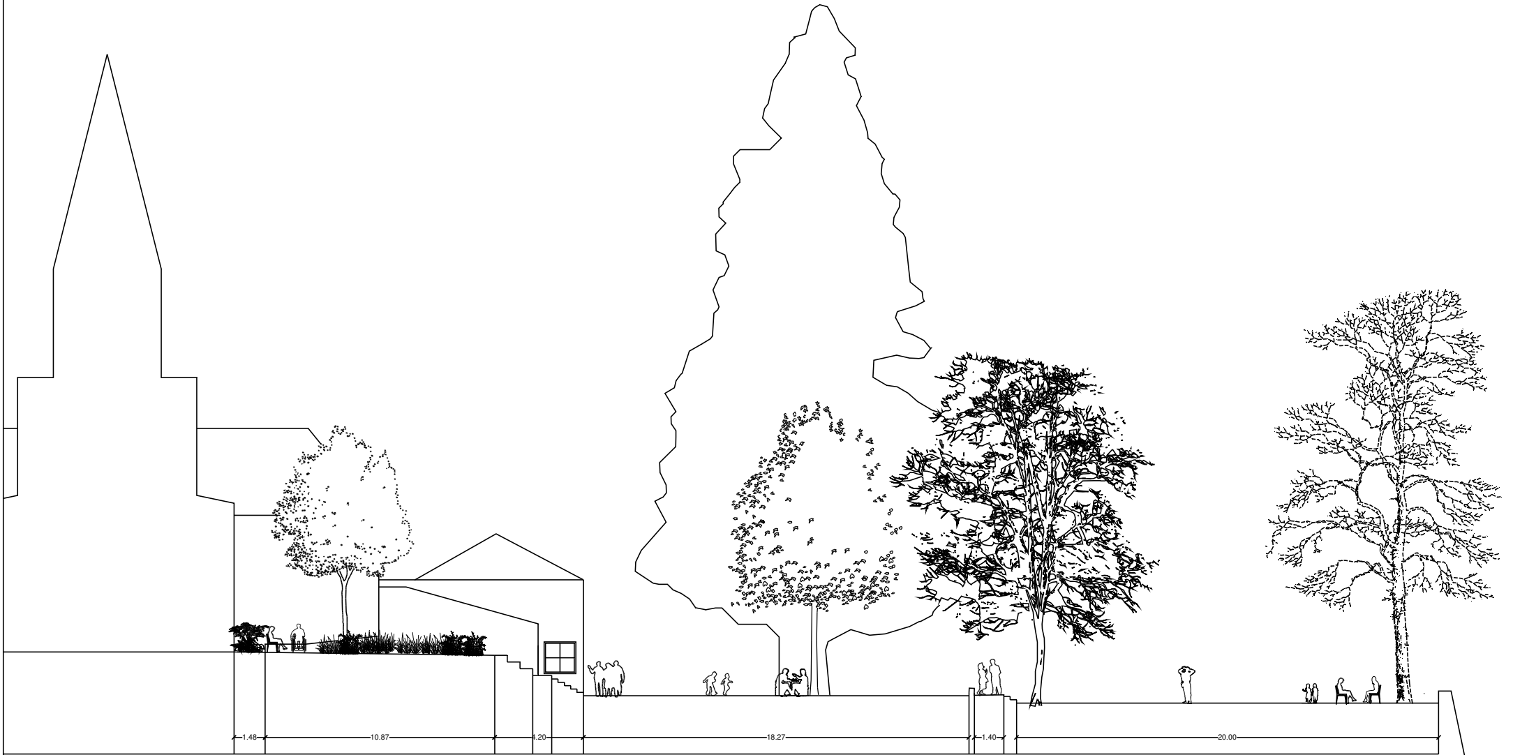
Profil A / Place de l'église, Sud