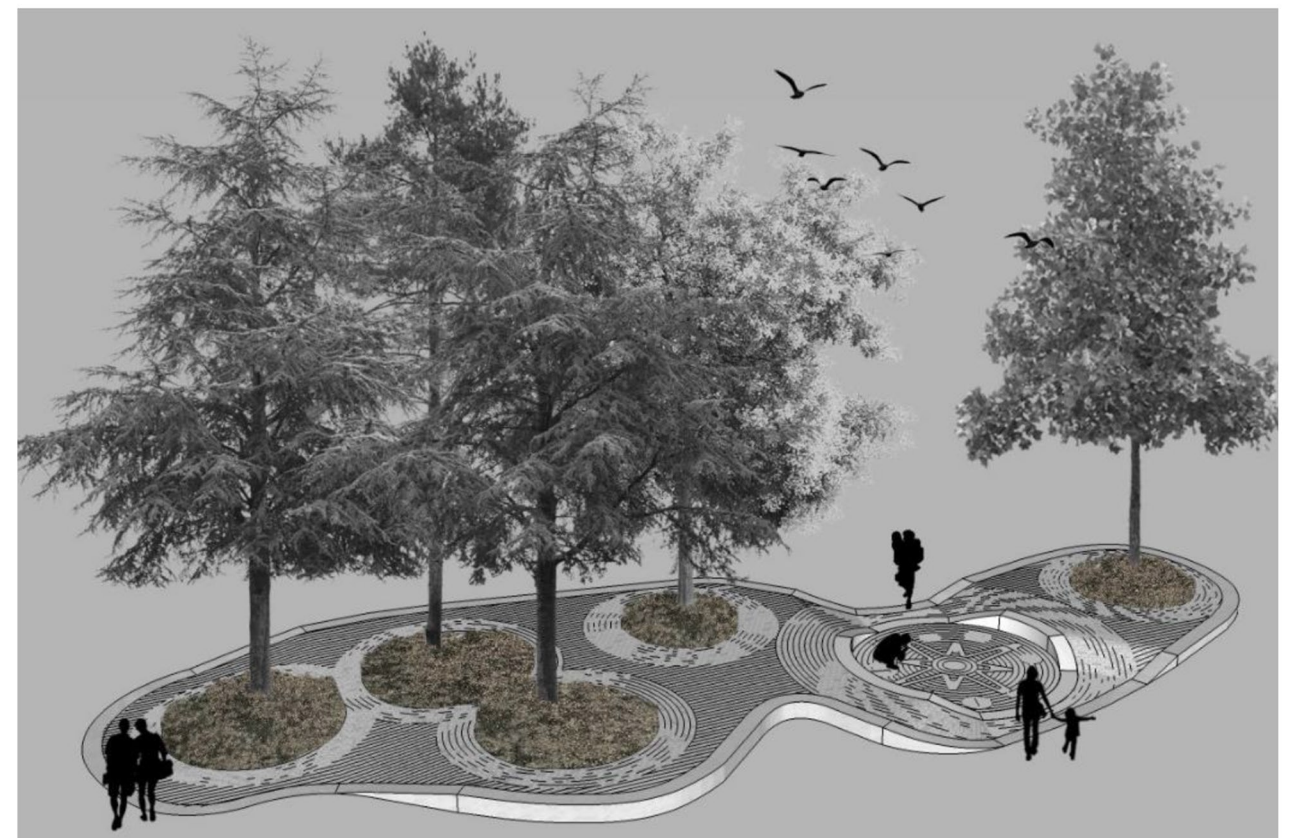
Détail colline centrale