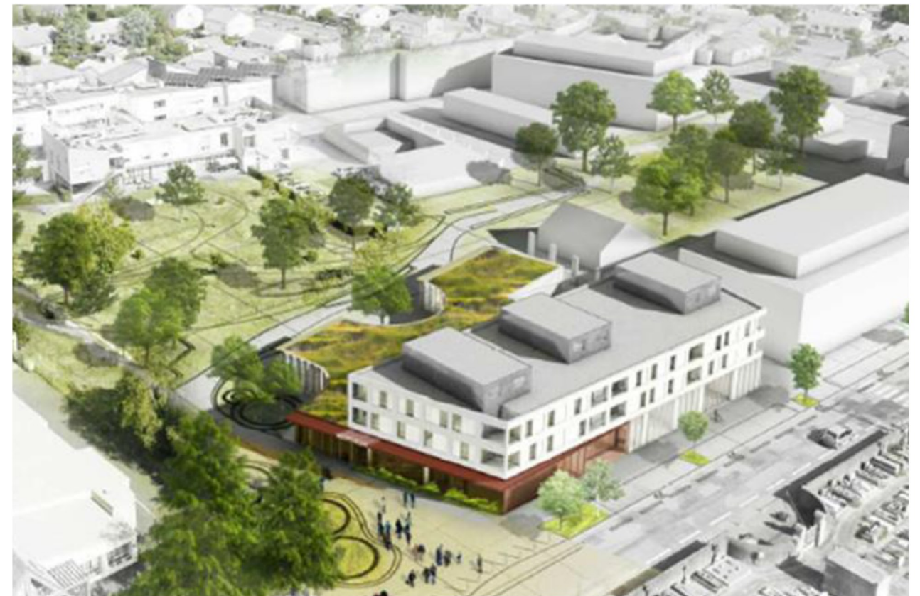
Vue réalisée par Tetrac