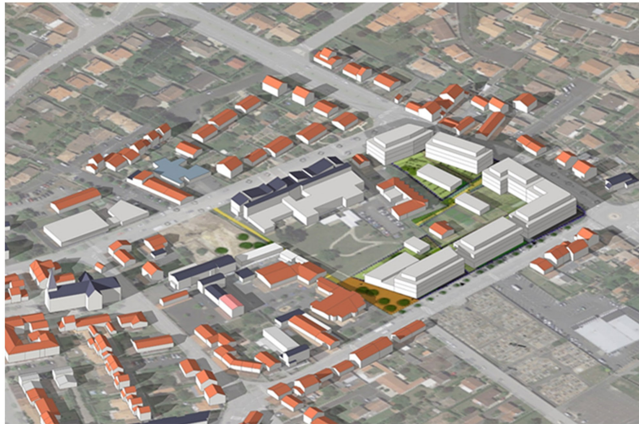
Modélisation 3D de l'îlot