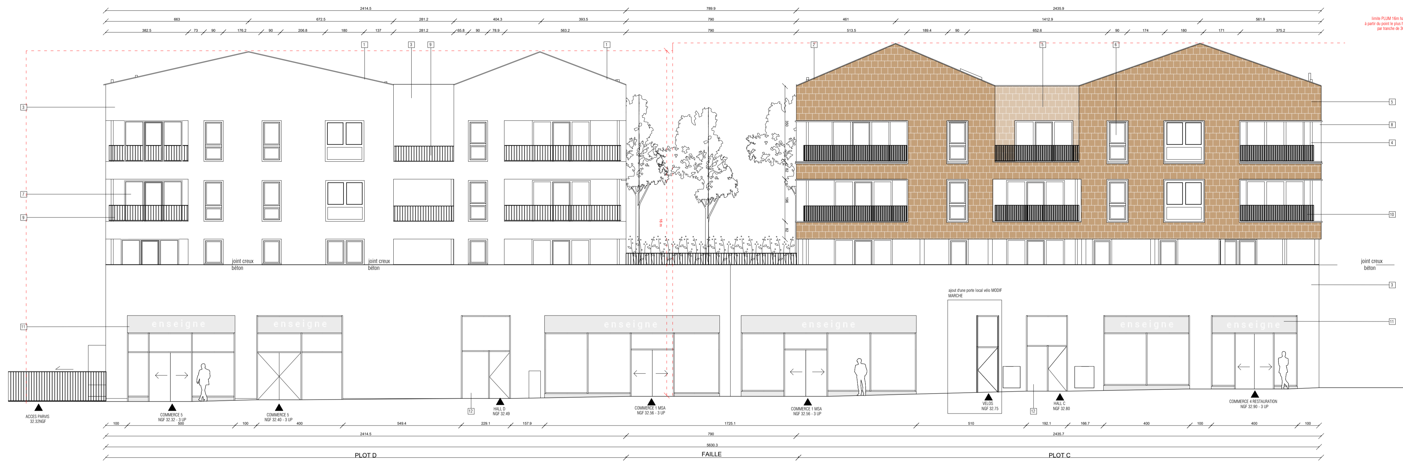
ELEVATION 1 Elevation sud-est - place du marché