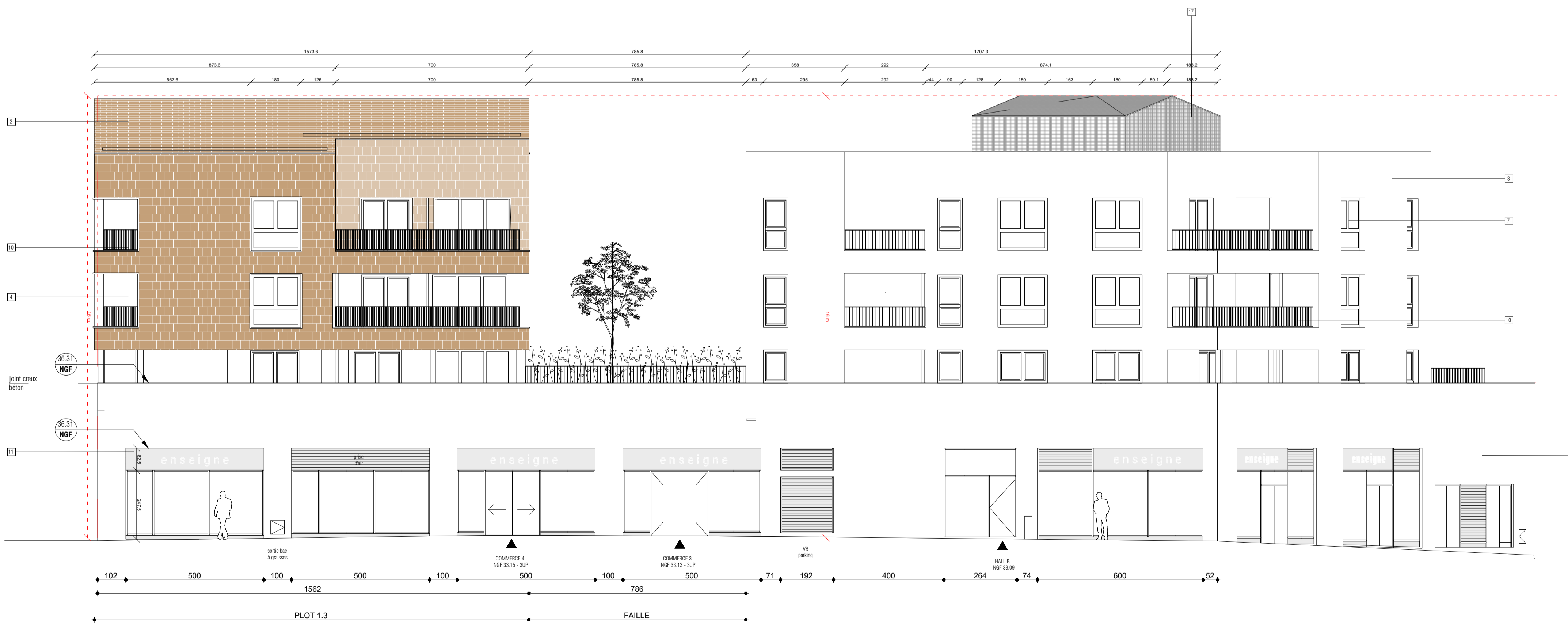
ELEVATION 2 Elevation nord-est Rue Georges Clemenceau