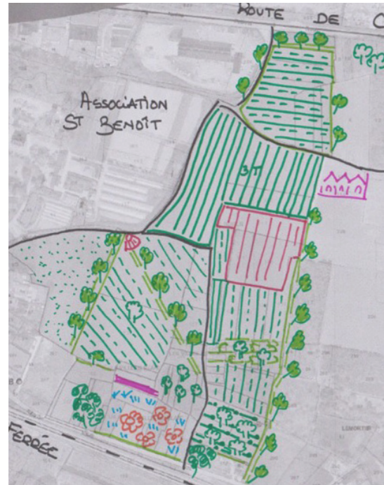
Les Intuitions . Nov 2022 . Schéma V1