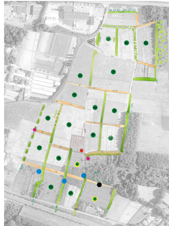
Appropriation . Avril 2023 . Schéma V3