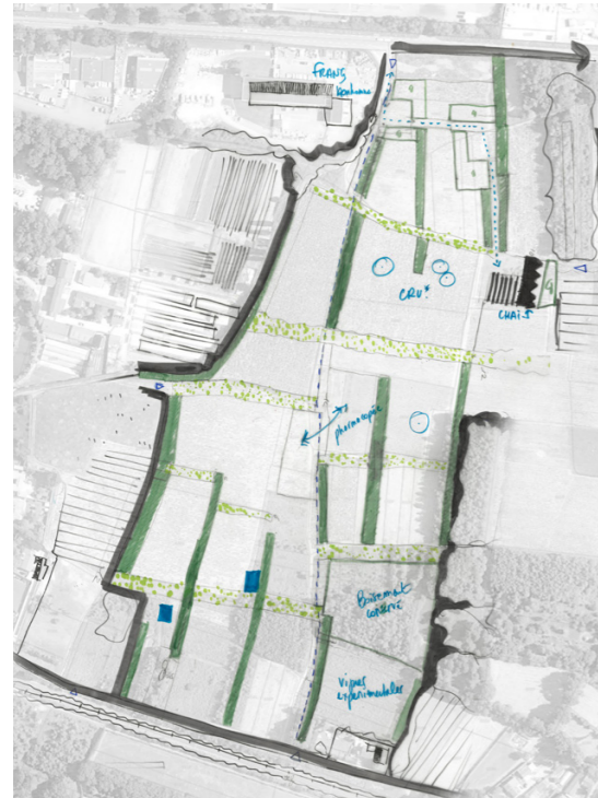
Les Propositions . Mars 2023 . Schéma V2