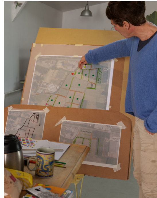
Atelier collaboratif au domaine